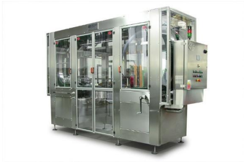
légende de l'image 6 Souffleuse renverseuse air/vapeur à tampons