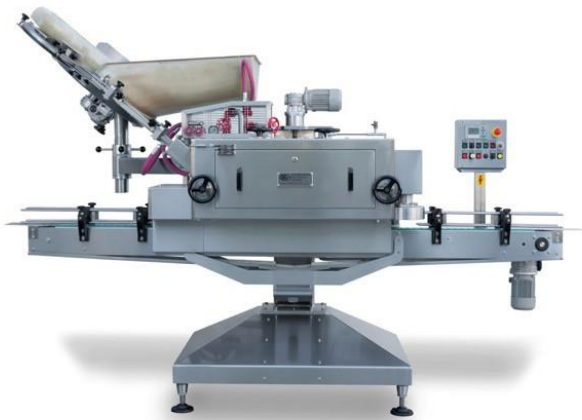
légende de l'image 21 Capsuleuse automatique linéaire couvercles pour Twist-off Mod. C 60