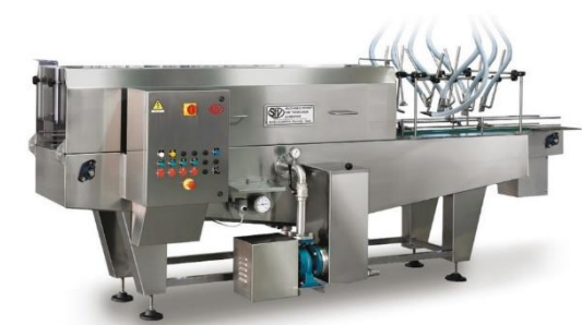
légende de l'image 27 Laveuse automatique linéaire Mod. L80CS