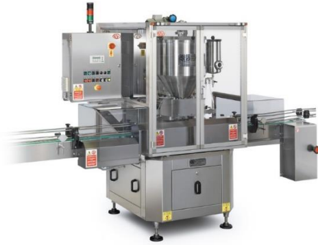
légende de l'image 12 Doseuse volumétrique automatique linéaire Mod. DVL