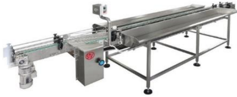
légende de l'image 9 Table de remplissage motorisée avec 2 convoyeurs