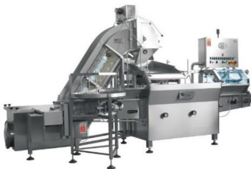
légende de l'image 8 Remplisseuse à vibration Mod. RPN