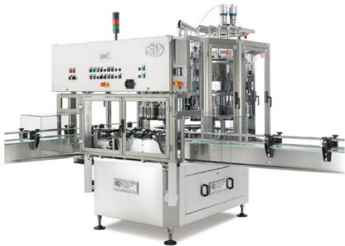
légende de l'image 16 Jouteuse rotative sous vide tangentielle Mod. CRST