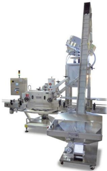
légende de l'image 19 Capsuleuse pour couvercles en plastic à pression Mod. CP