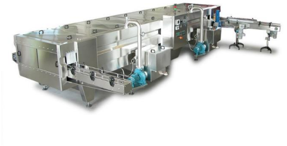
légende de l'image 26 Tunnel rechauffeur