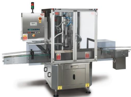
légende de l'image 14 Juteuse automatique linéaire sous vide Mod. LV 2