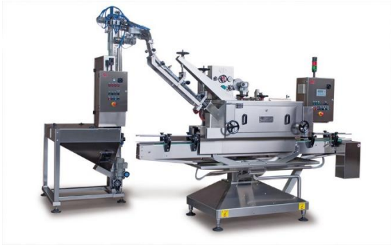
légende de l'image 23 Capsuleuse linéaire Mod. C 60 avec alimentateur magnétique