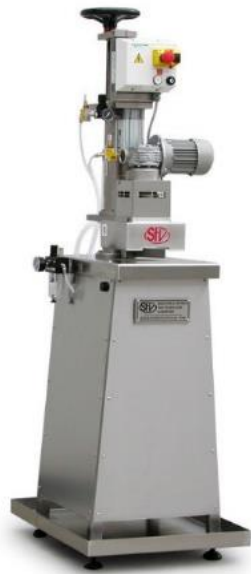
légende de l'image 24 Capsuleuse semiautomatique pour couvercles Twist-off Mod. CS