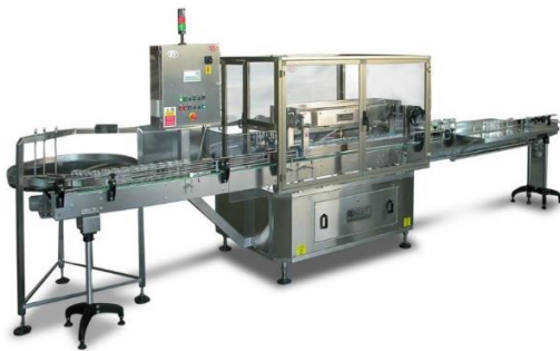
légende de l'image 7 Renverseuse souffleuse à air et/ou vapeur