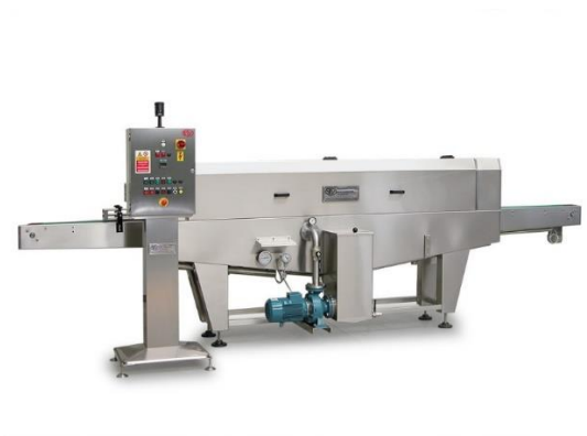
légende de l'image 28 Laveuse automatique linéaire Mod. SS