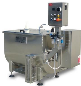
légende de l'image 2 Cuve horizontale à double enveloppe de cuisson et mélange produits