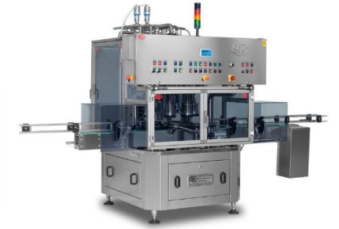
légende de l'image 15 Juteuse rotative sous vide Mod. CRS