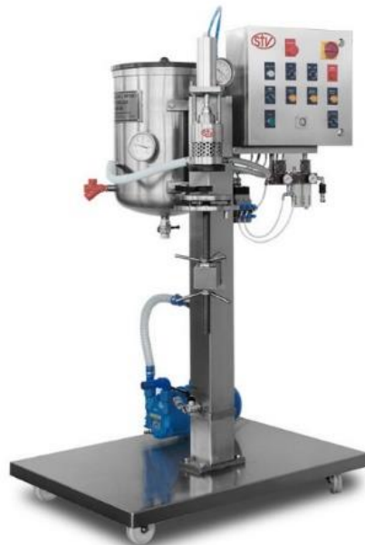
légende de l'image 17 Juteuse sous vide semi-automatique Mod. CS 1