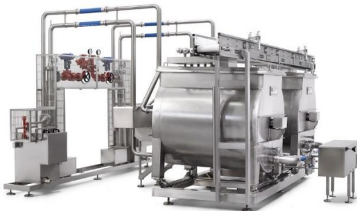
légende de l'image 1 Cuve de préparation de sauces