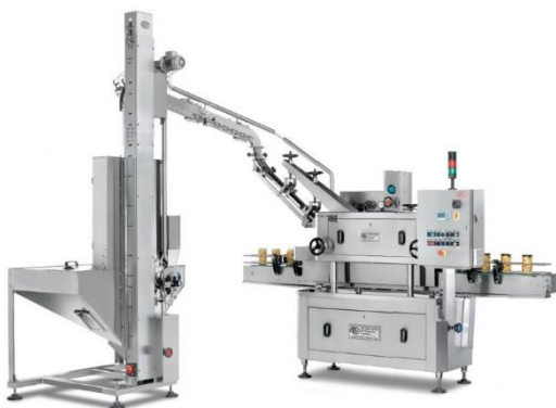
légende de l'image 22 Capsuleuse linéaire Mod. C 150 avec alimentateur magnétique