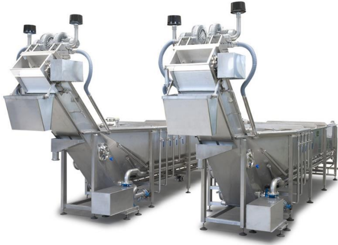
légende de l'image 3 Cuves de déssalage