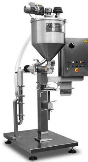
légende de l'image 13 Doseuse semi-automatique Mod. DSV 1