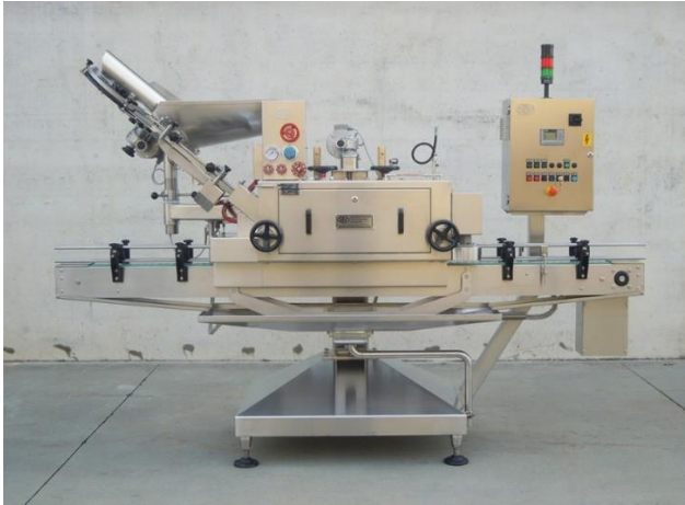
légende de l'image 20 Capsuleuse automatique linéaire pour couvercles Twist-off Mod. C 30