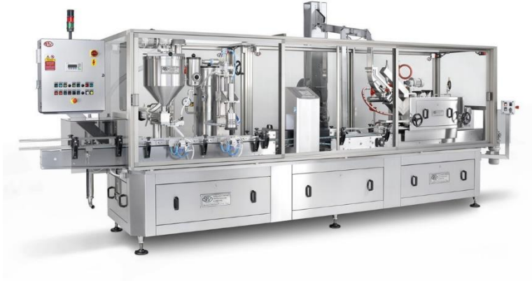
légende de l'image 18 Monobloc Mod. DCC (remplir et fermer avec couvercles)