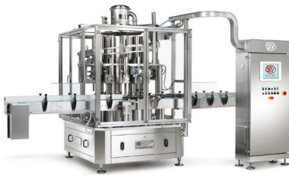
légende de l'image 10 Piston filler