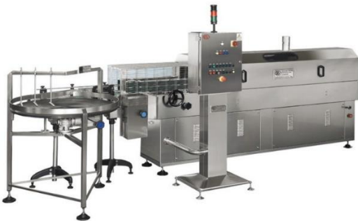
légende de l'image 5 Souffleuse air/vapeur à twist