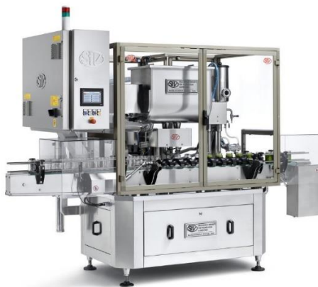
légende de l'image 11 Doseuse volumétrique automatique linéaire Mod. DVL-UT avec vannes à immersion